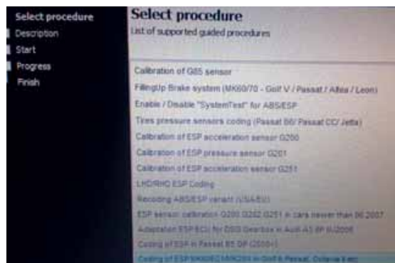
De One Click Functions kunnen gebruikt worden om vaak voorkomende werkzaamheden eenvoudig uit te voeren.